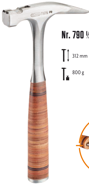
Nr. 790 1/2