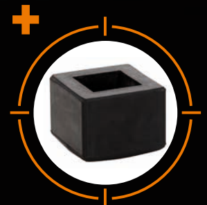
Gummiaufsatz für Fäustel